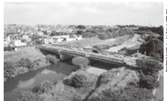
市内を流れる新河岸川