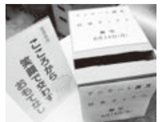
▲不正に関するアンケートを実施

をもって懲戒免職とされ、また管理監督責任として、前年度及び今年度の所属部長、課長及び主幹が訓告処分とされました。