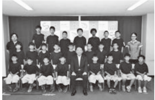
◀宗岡ミニバスケットボールスポーツ少年団男子チームの皆さんと香川市長

7月14日(金)、宗岡ミニバスケットボールスポーツ少年団の男子チームが市長を訪ねました。