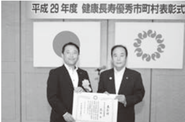
◀(右から)上田知事、香川市長

8月2日(水)、知事公館で、平成29年度健康長寿優秀市町村表彰式が行われました。市は、「健康寿命のばしマッスルプロジェクト」など、健康長寿に関する先進的な取組により、医療費の削減や慢性疾患の改善を図った自治体として表彰を受けました。