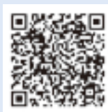
メール配信 登録画面