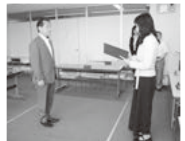
▲広島選挙管理委員会委員長から当選証書の付与がありました

新たなステージも、市民力を大切にし、市民の皆さんとともに課題を共有し、ともに汗を流しながら、パワフルにまちづくりを牽引していきたいと思っておりますので、これからの志木市のまちづくりに期待を寄せていただければ幸いです。