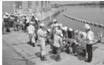
◀志木市消防団や志木市建設業防災協力会などの皆さんが万一来に備え、真剣な表情で取り組まれました。

5月19日(金)、集中豪雨による洪水や内水氾濫などの災害を想定した、「平成29年度志木市水防訓練」を行いました。