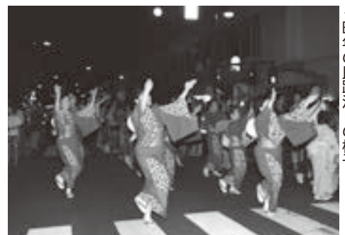
◀昨年の民踊流しの様子

今年も民踊流しが7月22日(出)19時30分から本町通りで開催されます。志木の夏の風物詩をぜひご覧ください。