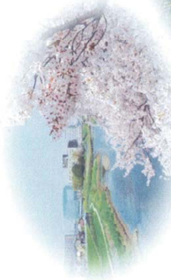
桜と柳瀬川と志木市役所