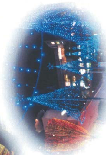
志木駅前イルミネーション