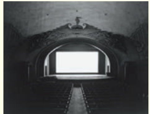
杉本博司《Avalon Theater, Catalina Island》