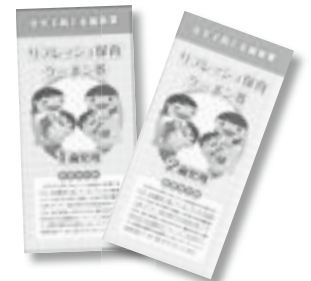
▲在宅で子育てする家庭を応援するリフレッシュ保育クーポン券