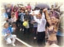
▲昨年は、市長も参加！ みんなでLet's サンバ！