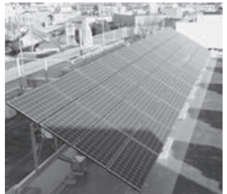
▲各学校に設置するソーラーパネル

ネージ看板とともに、市役所へ来庁される皆さんへのご案内を開始しています。このサイネージ看板も、お金を使わず民間の活力を活用し、設置・運用ともに広告収入で賄っています。