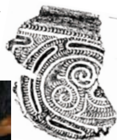
きれいな 文様出そう！