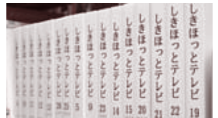
▲柳瀬川図書館で保管しています

その後、社名変更や合併などにより、J:COMさいたまへとその姿を変えましたが、当時放送していた番組の一部は、柳瀬川図書館で貸し出していますので、今でも観ることができます。もしかしたら、テレビに映っている自分の姿を発見できるかもしれませんね。