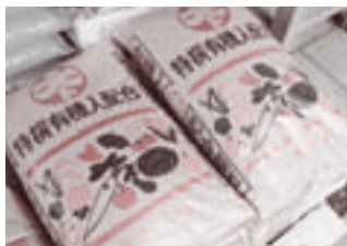
▲山田屋オリジナルの 特選有機入配合肥料

お店を移しました。 山田屋肥料店も、大正13年に現在の場所 にお店を移しました。 が開通すると、お店も引又河岸のあたりか ら、志木駅の方へと移っていったと、 山田屋肥料店も、大正13年に現在の場所 にお店を移しました。 55年には、14軒もの肥料店がありました。 大正に入ってから、東上鉄道(現東武東上線) が開通すると、お店も引又河岸のあたりか ら、志木駅の方へと移っていったと、 山田屋肥料店も、大正13年に現在の場所 にお店を移しました。