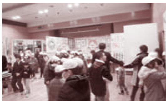
▲毎年、工夫を凝らした素敵な作品がたくさん並びます

毎年好評の市内7校の特別支援学級とみつばすみれ学園の子どもたちによる太陽展を今年も開催します。