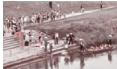
▲志木コミュニティまつりでの和船回遊

こうした舟運で栄えた歴史にちなんで、志木市コミュニティ協議会の設立35周年を記念して、昨年9月に行われた志木コミュニティまつりでは、アトラクションの一つとして新河岸川の和船回遊が行われ、たくさんの人が川に親しむひとときを過ごしました。