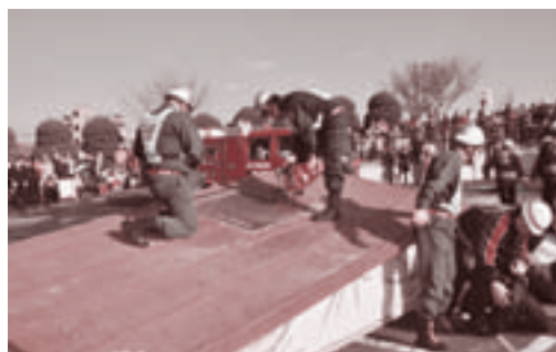
▲新河岸川への一斉放水 ▲救出・救護訓練