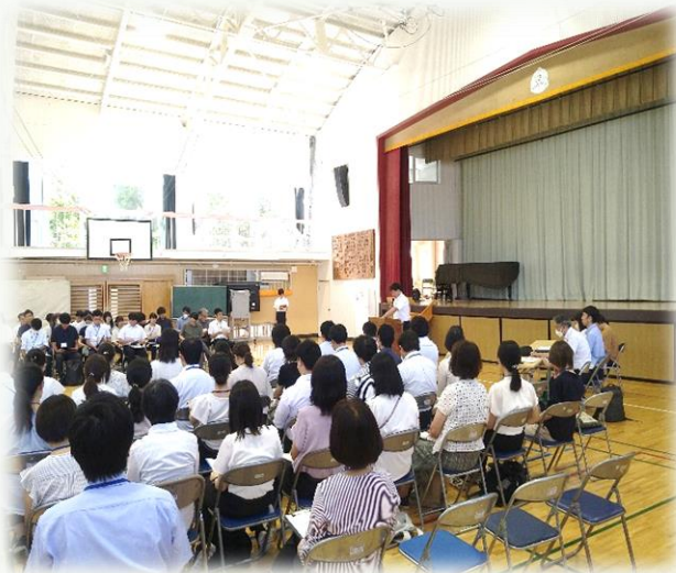
小中一貫教育推進計画案の説明を真剣に聞き入る3校の先生方

8月25日に志木中学校区の3校の教員が志木第三小学校に集まり合同の研修会を実施しました。この研修会は、「①志木中学校区3校で、連携・一貫教育を推進し、9か年を見通した質の高い教育活動を展開する。」「②3校が協働することで、児童・生徒理解を深め、進級・進学時のギャップ軽減や、意図的かつ一貫性のある指導の在り方へとつなげる。」を大きな目的とし、年度内に3回計画されています。