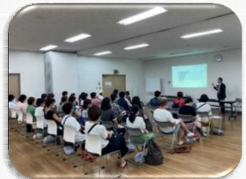
小中一貫教育の目的や導入経緯について説明

令和5年7月15・18・20日に、志木第二中学校区の保護者や地域住民、学校関係者、22日には市民を対象に「小中一貫教育・義務教育学校に関する懇談会」を実施しました。事前にいただいた質問への回答も含めながら、説明をさせていただきました。