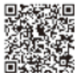
▲市ホームページQRコード