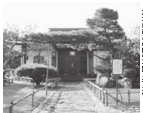
◀志木市最古の歴史を誇る千光寺

また、応永25年(1418)の年号と寄進者の名を刻んだ市指定文化財の銅製の鱧口があり、これは青梅市御岳神社に奉納されている鱧口とよく似ていると言われています。