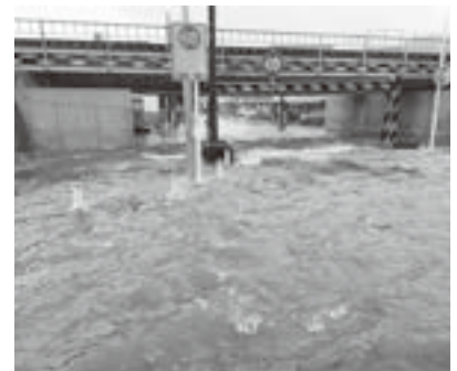
▲今回の台風で冠水被害が発生した神明橋付近

堤防で越水のおそれが生じ、午後1時20分、志木小学校及び志木第三小学校に避難所を開設し、柏町1丁目と2丁目に避難勧告を発令したところです。幸いにして、越水は起こらず、午後8時には避難勧告を解除しました。