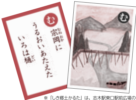
※「しき郷土かるた」は、志木駅東口駅前広場の舗装の一部に、絵タイルとして敷設されています。

志木市役所 〒353-0002 志木市中宗岡1-1-1 ☎048(473)1111(代表) ☎048(472)3766 柳瀬川駅前出張所 ☎048(472)4449 志木駅前出張所 ☎048(473)3988