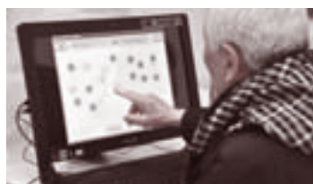
▲脳年齢などを測定し記録をつけることで、自身で脳の状態を把握できます

さまざまな講座運営を行う中で、特に今、力を入れているのが、1月からはじめた脳活フィットネスパークという講座です。実際に体を動かして行う脳活体操や、記憶脳を強化するドリルの脳活訓練、ヘッドホンで脳活用の音を聞くブレインマッソーなど、認知症を予防するための講座を実施しています。高齢化が進む現代において、「認知症になったらどうしよう」という不安を少しでも取り除くお手伝いができたらという想いから、国の支援を受けてはじめた事業です。