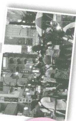
特設ステージにて、 ハワイアン演奏とフ リーのタレが行われま す。 各国の料理の屋台 (国際屋台村)や多くの 模擬店も並びます!