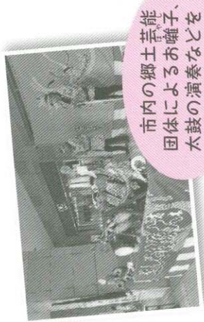
市内の郷土芸能 団体によるお囃子、 太鼓の演奏などを ご鑑賞ください。